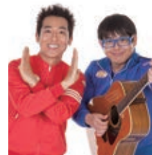
お笑い芸人 / テツ and トモさん